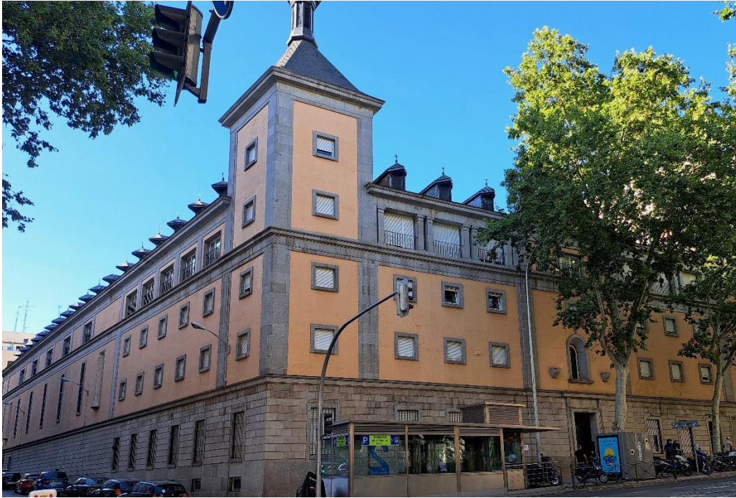
Antiguo C.O.C. en la calle Marqués de Urquijo, 18. Madrid.

RESUMEN: ¿Cómo llegaba una mujer a un centro del Patronato? Todo comenzaba con una denuncia, por cualquier comportamiento que la moral franquista calificaba de peligroso. Las “visitadoras” en cines, playas, bailes, la policía o la propia familia denunciaban a una mujer. Tras la denuncia era “clasificada” para decidir a qué tipo de centro sería enviada. Lo primero era establecer si era “completa” o no (es decir, si era virgen). A continuación, quedaba internada en alguno de los centros gestionados directamente por el Patronato o por las órdenes religiosas colaboradoras. Desde ese momento, el Patronato asumía la patria potestad. Cuando finalmente conseguía salir, debía permanecer dos o tres años en vigilancia tutelada. Siempre con el estigma de haber pasado por el Patronato. Funcionó desde 1941 hasta 1985.