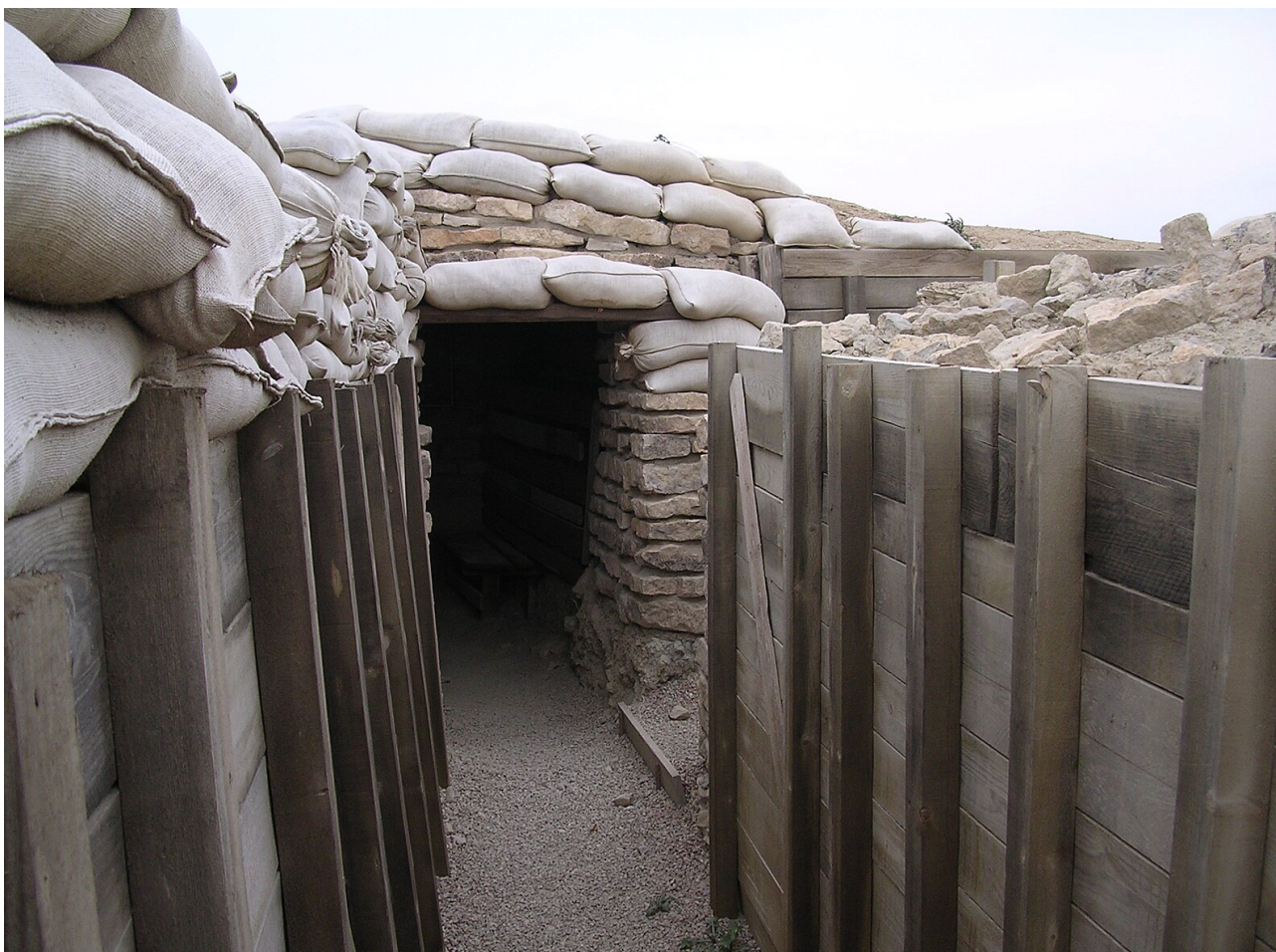
Trincheras de Alcubierre (Monegros, Huesca). Ruta Orwell.